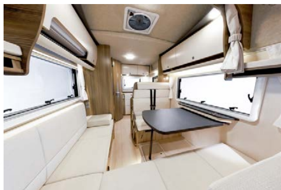
ZiL - インテリア