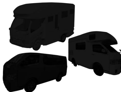
新型車両 3 台