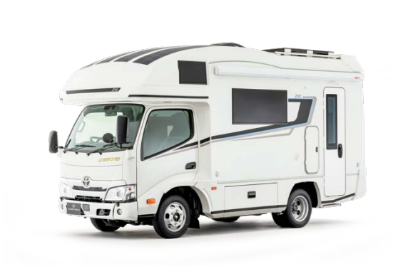
ZiL - エクステリア